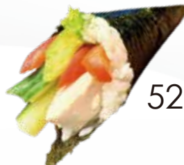
52 / SPECIAL Pesce misto maionese, avocado allergeni /3.4