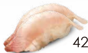
42 / SUZUKI Branzino allergeni /4