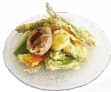
160 / TEMPURA VERDURE allergeni /1