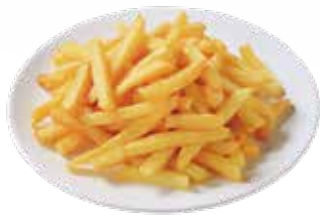
A1 / PATATINE FRITTE allergeni /