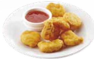
A4 / POLLO FRITTO allergeni / # .3