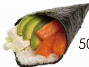
50 / SAKE Salmone, avocado insalata, maionese allergeni /3.4

Cono di riso avvolto in alga nori e farcito