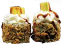
A7 / HOSOMAKI MANGO Mini roll di riso fritti, farciti con salmone guarniti con philadelphia e mango e salsa teriyaki allergeni /1.3.4