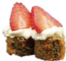
A5 / HOSOMAKI FRAGOLA Mini roll di riso fritti, farciti con salmone guarniti con philadelphia e fragola e salsa teriyaki allergeni /1.3.4