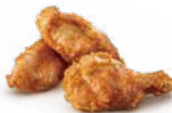
A8 / ALETTE DI POLLO