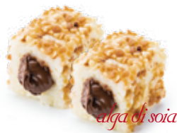
A6 / NUTELLA MAKI Rotoli piccoli di riso farciti con nutella allergeni /6.7.8