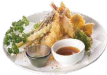
162 / TEMPURA MARIAWASE Tempura di gamberi e verdure allergeni /1.2