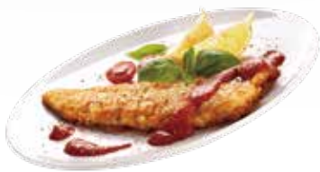
A3 / COTOLETTA POLLO allergeni /*.1.3