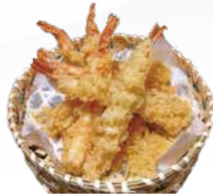
161 / TEMPURA GAMBERI allergeni /*.1.2