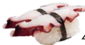
46 / TAKO Polipo allergeni /*.14