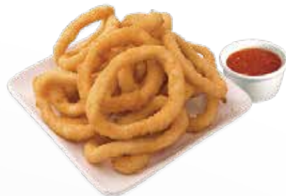
164 / TEMPURA CALAMARI allergeni /*.1.14