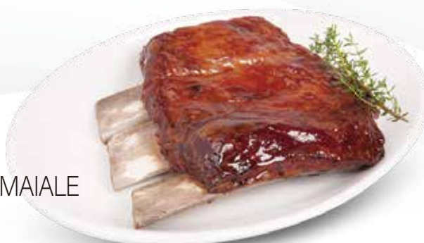
A9 / COSTINE DI MAIALE