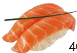
40 / SAKE Salmone allergeni /4

Bocconcini di riso con fettina di pesce o altro ingrediente