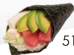
51 / MAGURO Tonno, avocado, insalata, maionese allergeni /3.4