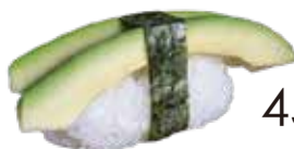
45 / ACOCADO Avocado allergeni /