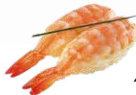
43 / EBI Gamberi cotti allergeni /*.2