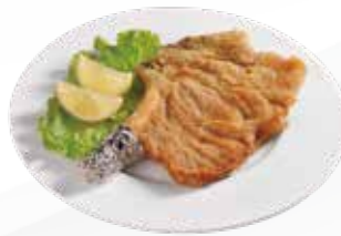
A2 / COTOLETTA DI MAIALE allergeni /*.1.3