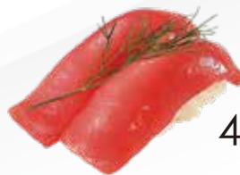
41 / MAGURO Tonno allergeni /4